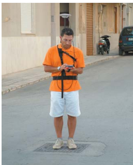
Rilievo in campagna con palmare GPS

Quotidianamente, i dati acquisiti in campagna, vengono scaricati nel sistema centrale presente nell'Ufficio SITR del Comune di Mazara e immediatamente, utilizzando il software d'ufficio per la gestione dei dati GPS, post-processati rispetto al-