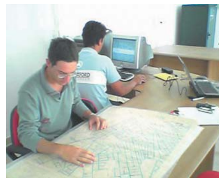
Elaborazione dei dati in ufficio

operatori del settore o alle aziende erogatrici di servizi di avere una visione completa delle reti di sottoservizi esistenti. Sarà cura dell'Amministrazione Comunale poi tenere aggiornati i dati rilevati, con i successivi interventi di sottoservizi che si andranno a realizzare. Tale operazione potrà essere compiuta dagli stessi tecnici comunali o essere affidata a geometri liberi professionisti creando quindi opportunità di lavoro.